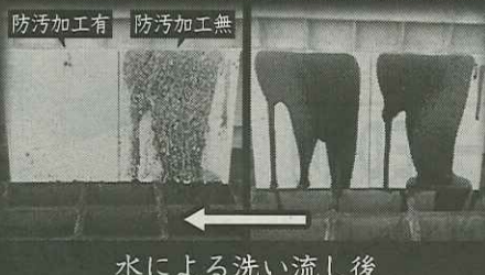
水による洗い流し後

工場と直接打ち合わせができるので、要望が確実に伝わります。工場から直接お届けするので、短納期で対応できます。工場と直接取引なので最小限の経費でお届けできます。